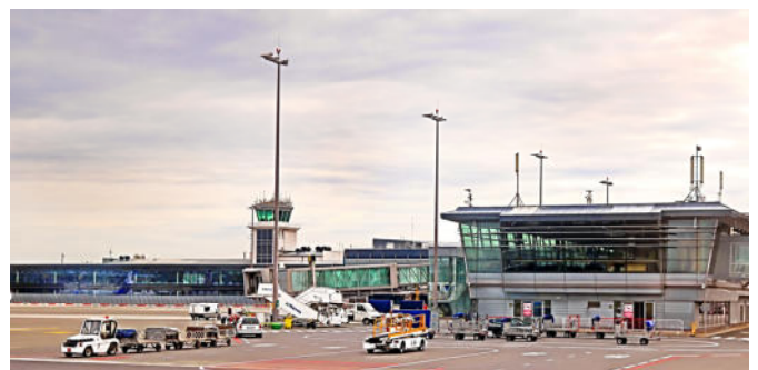
Riga International Airport

Auch der Bausektor gewinnt an Bedeutung. Lettlands Bruttoanlageinvestitionen, die 2020 mit 6,9 Milliarden Euro quasi auf dem Vorjahresniveau lagen, sollen 2022 deutlich zulegen. Auf die Ausgaben für Bauten entfällt dabei mehr als die Hälfte der Bruttoanlageinvestitionen. ■